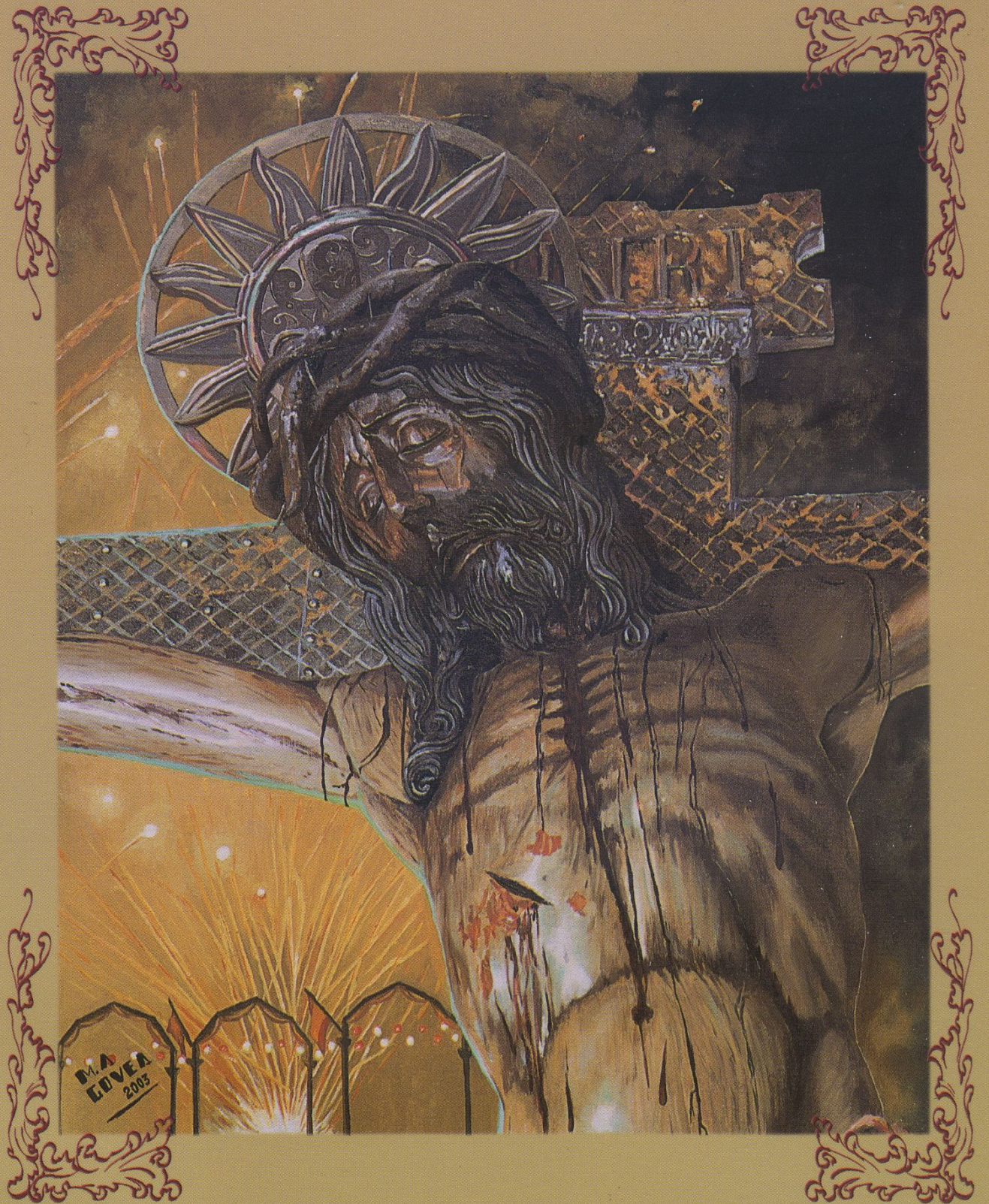
Pontificia, Real y Venerable Esclabitud del Santísimo Cristo de La Laguna Septiembre 2003