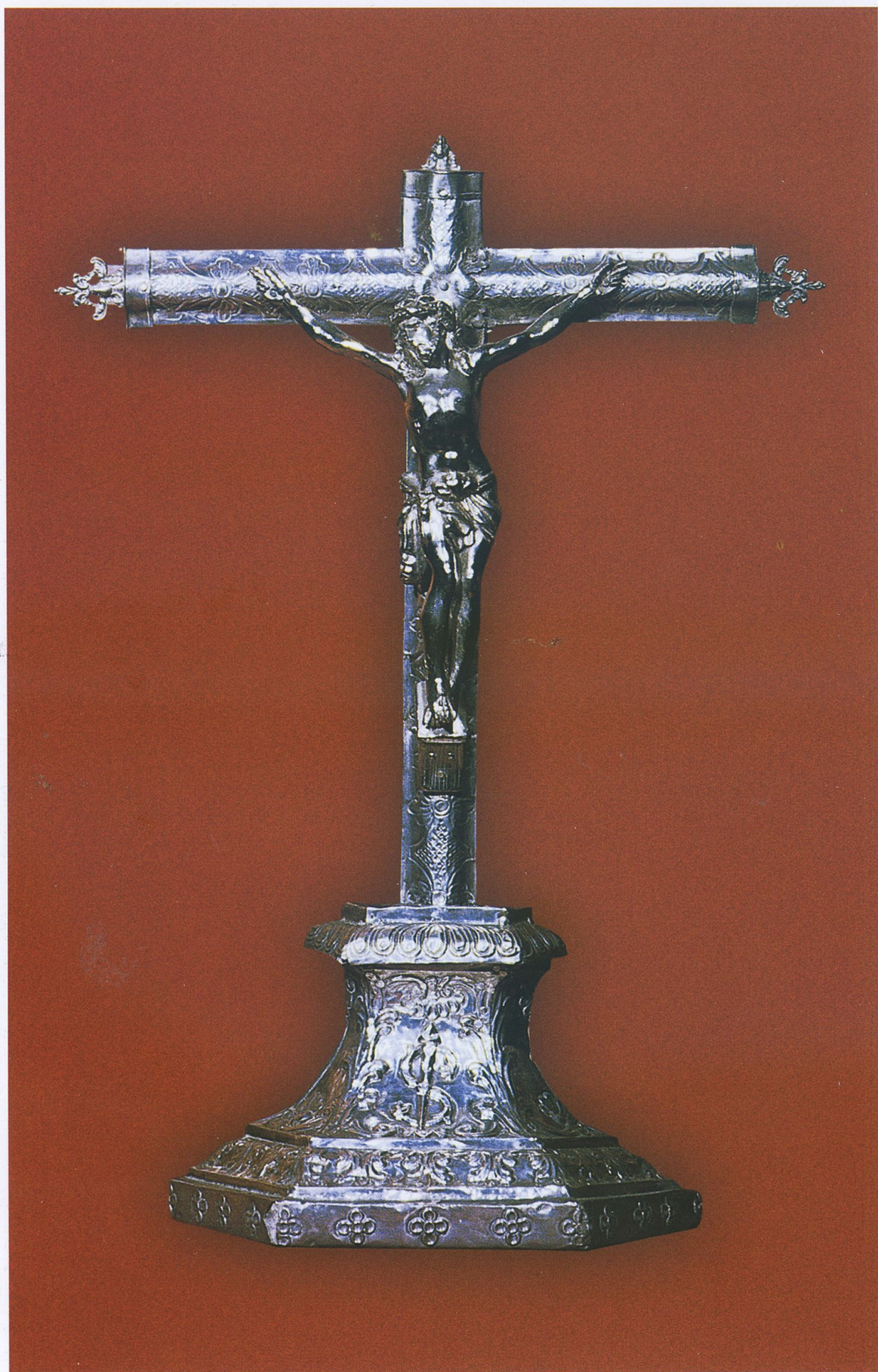
Crucifijo en plata repujada del Museo de la Pontificia, Real y Venerable Esclavitud.