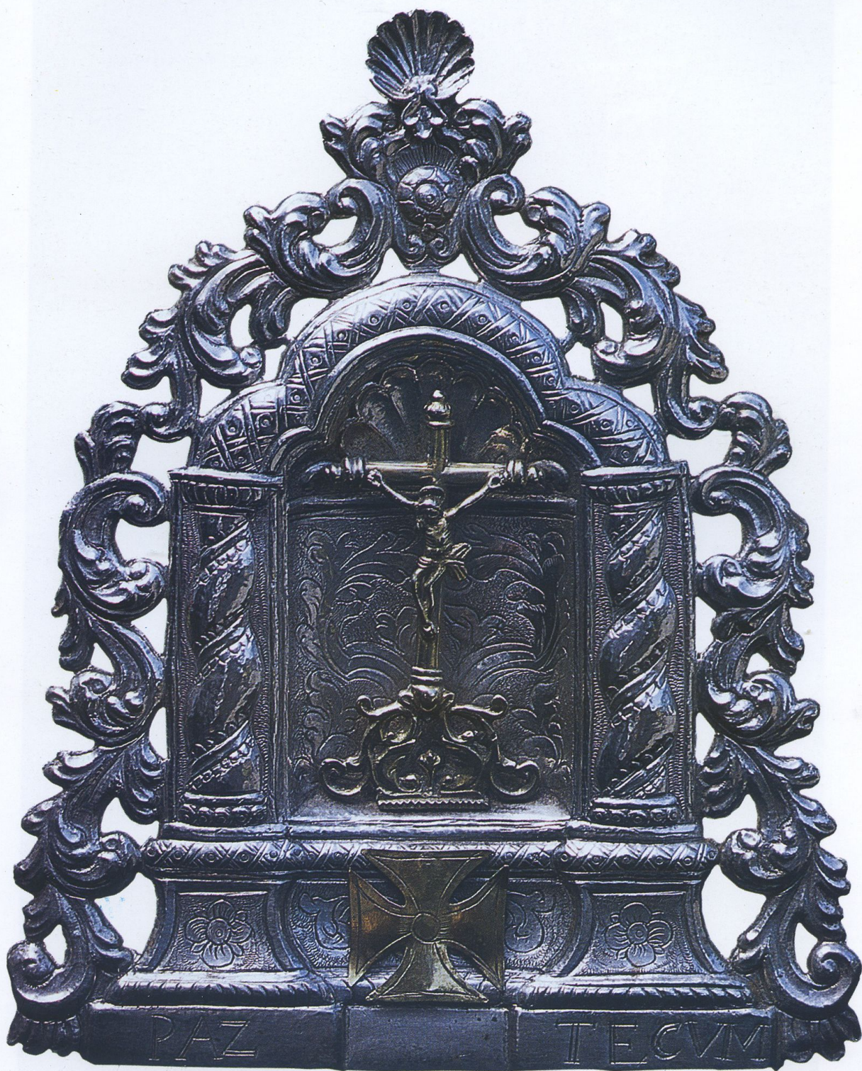
Portapaz del Museo de la Pontificia, Real y Venerable Esclavitud Miniatura en plata repujada del Altar del Santísimo Cristo de La Laguna.