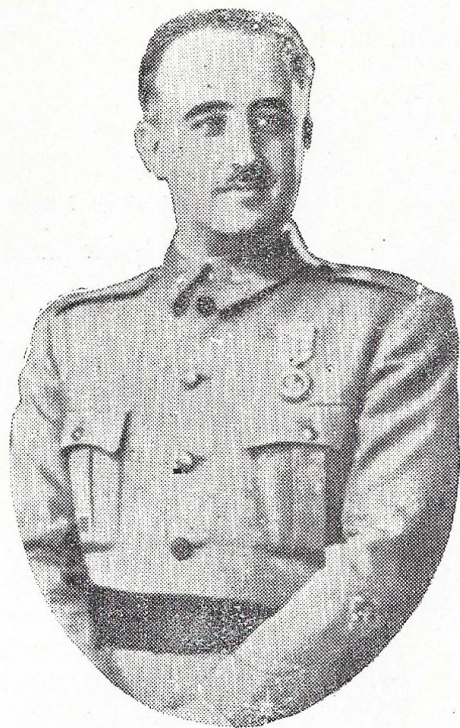
Excmo. Sr. D. Francisco Franco Bahamonde, Jefe del Estado Mayor, Generalísimo de los Ejércitos y Esclavo Mayor Perpetuo de la Pontificia y Venerable Esclavitud del Stmo. Cristo de La Laguna.